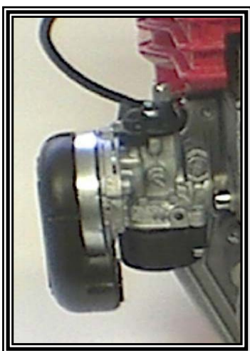
Slika : 4.2.