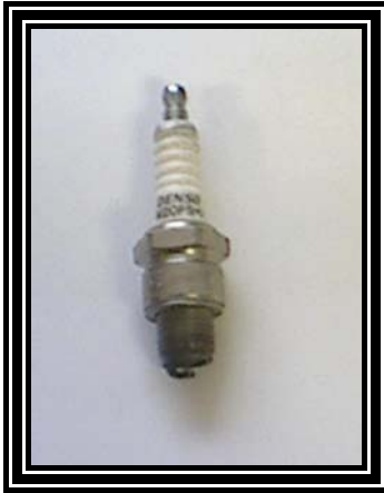
Slika : 4.5.

Dovoljena uporaba samo originalne sklopke. Zobnik sklopke motorja 11 zob.